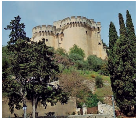
Das Fort Saint André, im 14. Jahrhundert als Machtsymbol der Könige von Frankreich erbaut, ist ein Wahrzeichen der Rheinbacher Partnerstadt Villeneuve lez Avignon.