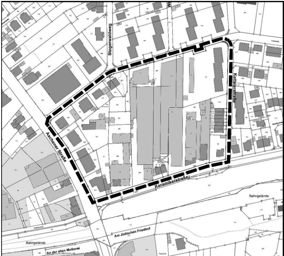
Lageplan mit Einzeichnung des Geltungsbereichs des Bebauungsplanes Rheinbach Nr. 4 „Peppenhovener Straße“, 2. Änderung, Bereich Leberstraße, Kettelerstraße, Keramikerstraße und Aachener Straße (ohne Maßstab)